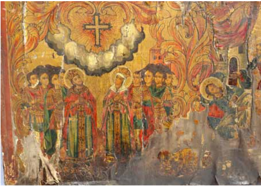
сл. 3. икона, Св. Константин и Елена, црква Св. Богородица Битола 1878 - деталъ Визијата и Чудесното појавување на Чесниот Крст