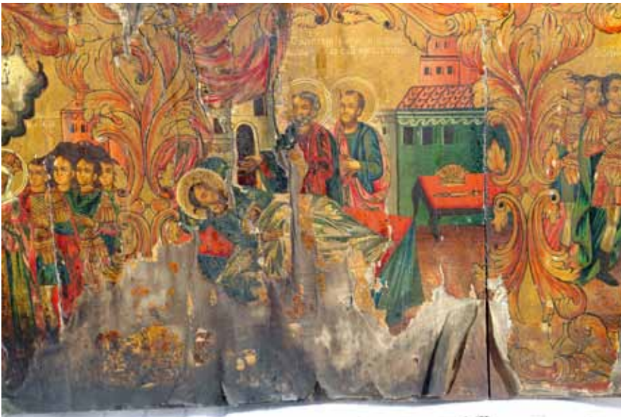
сл. 4. икона, Св. Константин и Елена, црква Св. Богородица Битола 1878 – деталъ Јавување на апостолите Петар и Павле во сон на царот Константин

Меѓу иконите кои го чинат богатиот иконописен фонд на црквата Св. Богородица во Битола, по своите димензии и стилско-ликовни особености се издвојуваат неколку икони кои чинат засебна целина, од која што, ја издвојуваме иконата на св. Константин и Елена со сцени од нивниот живот.