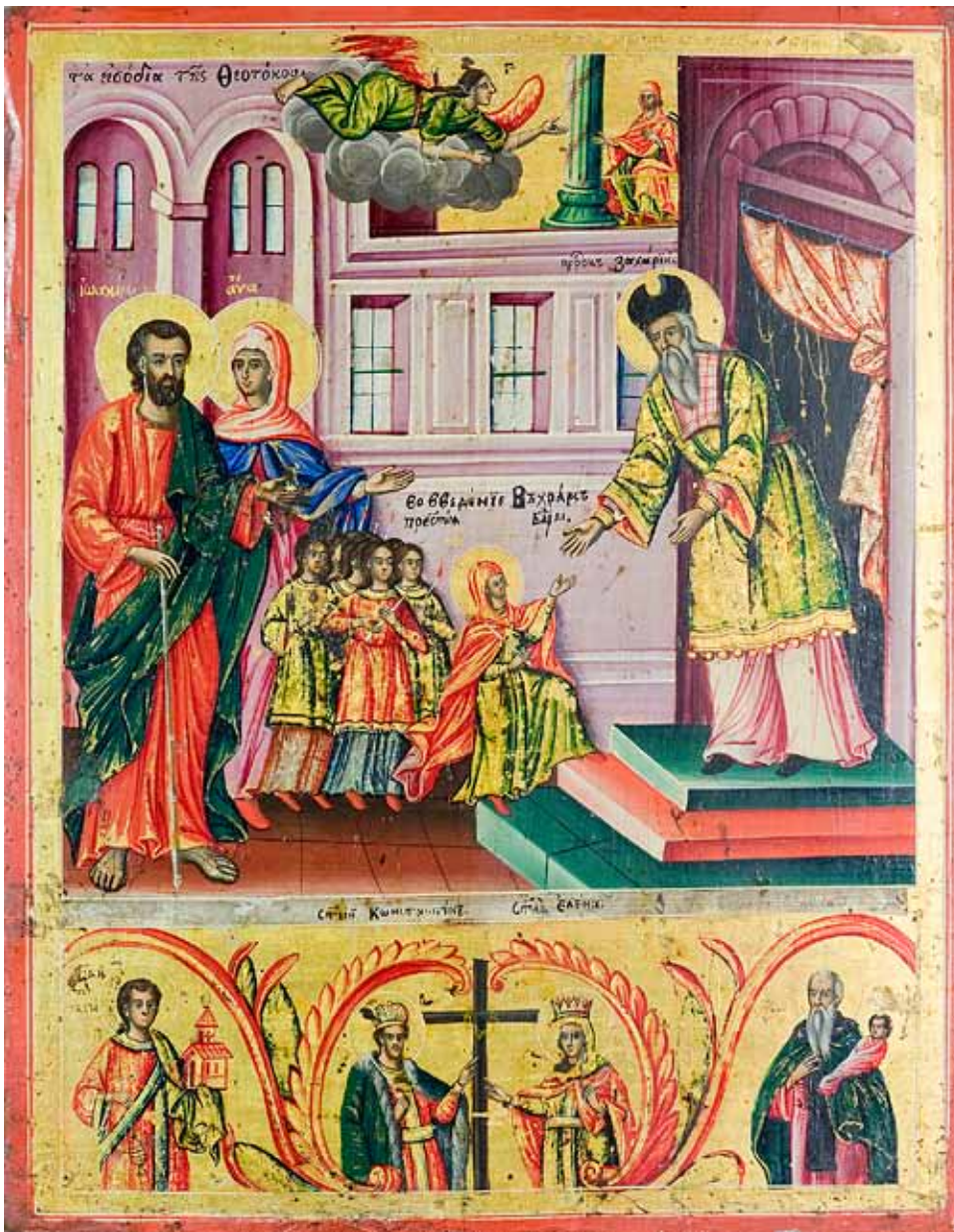
сл. 12. икона, Воведение на Богородица, Св. Константин и Елена, Св. Стилијан, Св Стефан Архиѓакон, 1864 црква Св. Никола Ѓеракомија

самата популарност на култот на овој светител меѓу власите, кои, всушност се ктитори на црквата Св. Никола, како што е запишано и во ктиторскиот натпис. 28