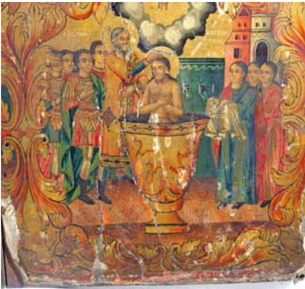
сл. 5. икона, Св. Константин и Елена, црква Св. Богородица Битола 1878 – детаљ Крштевање на царот Константин

ва круцијалниот настан Крштевањето на царот Константин . Крценіе Костантина.