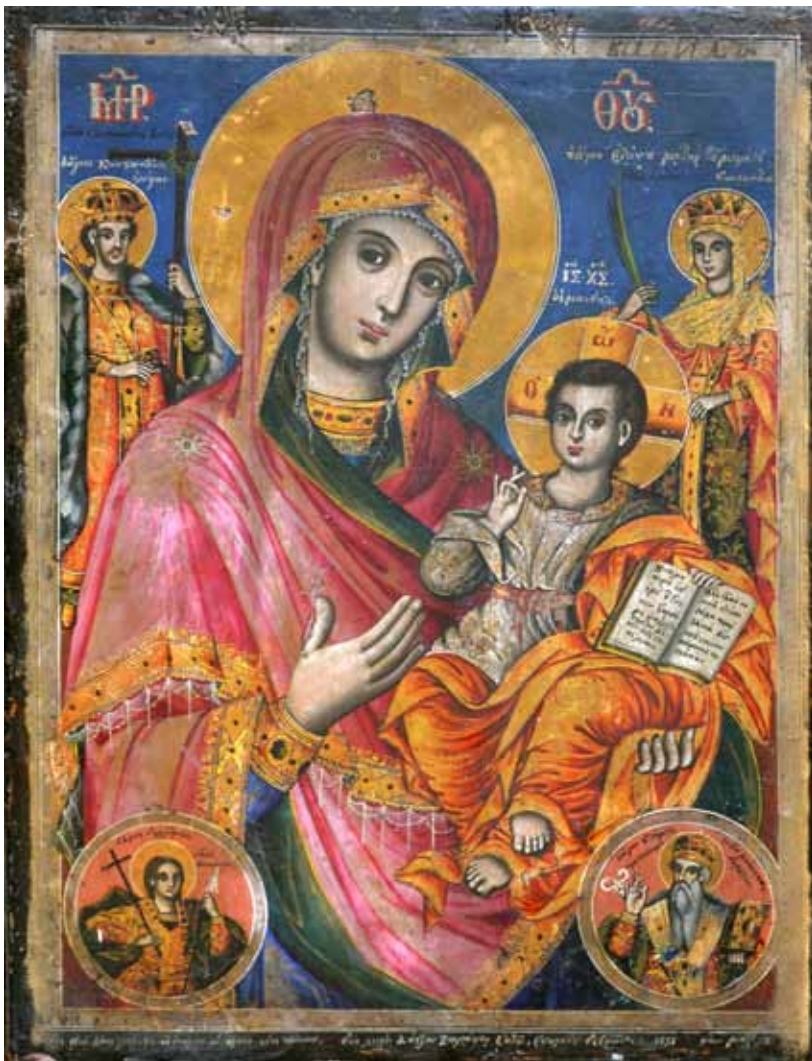
сл. 9. икона, Св. Константин и Елена, црква Св. Никола Геракомија 1862, автор Дичо Зограф

ствизантиската уметност сцената на Крштевањето ја следиме во рамките на циклусот во припратата на манастирот Хурез (1694 г.) во Романија изграден од принцот Константин Бранковеану, 18 како и во илустрираниот циклус на царот Константин во припратата на манастирот Ксирпотам (1783 г.) на Света Гора Атонска. 19