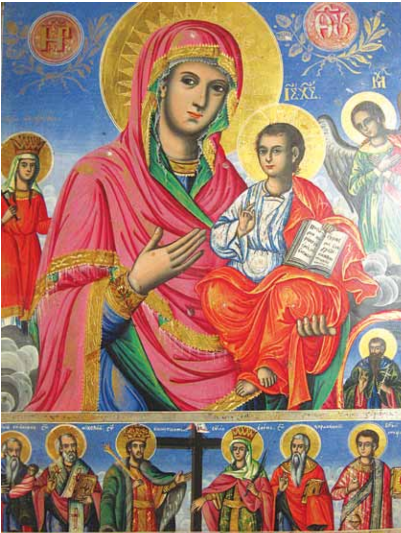
сл. 10. икона Св. Богородица со светци, архангел Михаил, Св. Александра Солунска, Св. Атанасиј Персиски, Св. Константин и Елена, Св. Никола, Св. Стилијан, Св. Харалампиј, Св. Стефан Архиепископ, 1863 црква Св. Богородица Перивлепта

прави особен впечаток е дека најголемиот број на сочувани претстави на Константин и Елена потекнуваат од Охрид и нивните ликови ги среќаваме на повеќе икони од охридските цркви slikани како самостојни ликови или пак вклопени и во посложени иконографски целини.