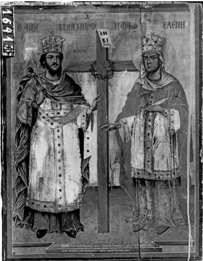
сл. 7. икона Св. Константин и Елена, црква Христово Преображение, Прилеп 1871, автор Никола Михаилов