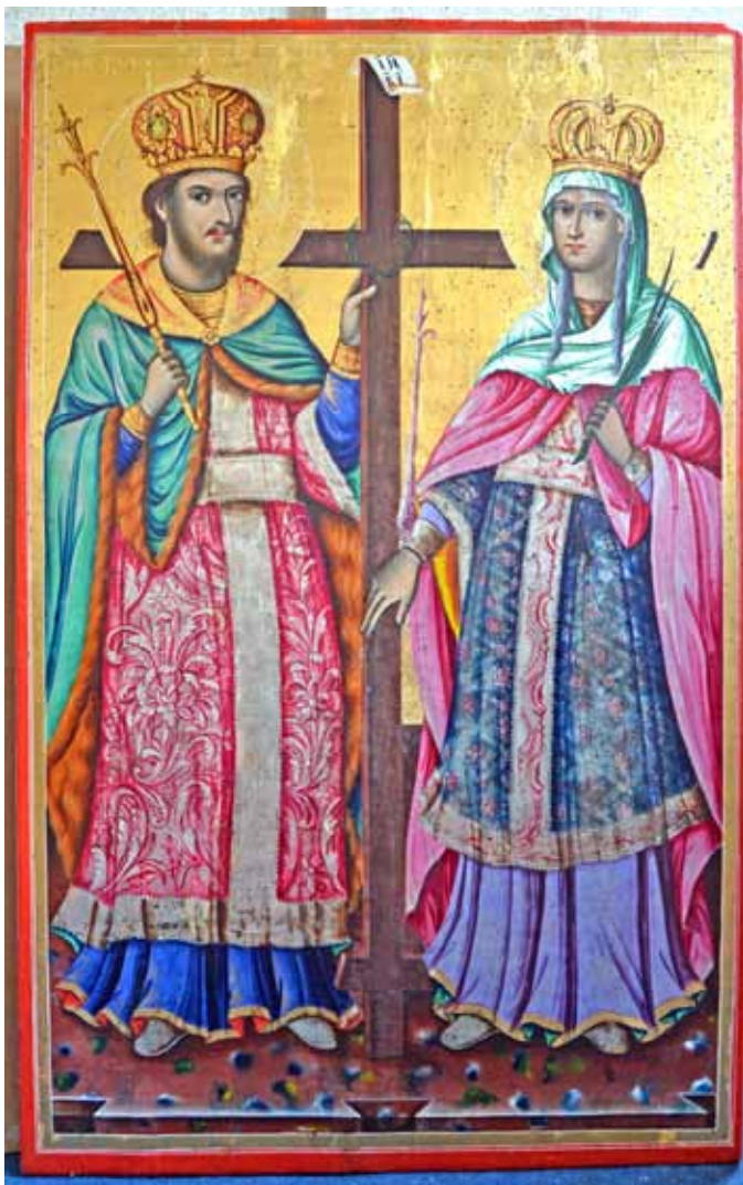
сл. 13. икона, престолна, Св. Константин и Елена, црква Св. Никола Долна Влашка маала, 1863 г.

во традиционална иконографија, со одредни измени кои што се вметнати под влијание на фигурите од Стематографијата на Жефаровиќ. (сл.15) Константин над традиционалната царска одежда, дивитисионот и лоросот, носи хермелинска наметка, кратко жезло во десната рака и крст во левата, а на главата круна од типот на каналафкион. И царицата Елена над царската одежда носи едноставна наметка, а на главата под круната едноставна бела марама. Нивните претстави се придружувани од св.Стилијан и младиот пророк Данил.