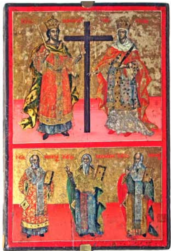
сл. 6. икона, црква Св. Благовештение Прилеп, Св. Константин и Елена, Св. Никола, Св. Атанасиј и Св. Харалампиј

Инаку сочувваните примери на оваа сцена од средновековната уметноста како и поствизантиската, укажуваат дека Визијата на чесниот крст е всушност една од најчесто сликани при илустрирање на житието на царот Константин, со тоа што иконографијата е сосема поинаква, царот Константин се слика јавнат на коњ во придружба на повеќе коњаници, ангелот Господов е пред него и го предводи, насликан во лет или пак седнат на коњ како воин покажувајќи го Чесниот Крст и патот кон Милвикискиот мост. 11