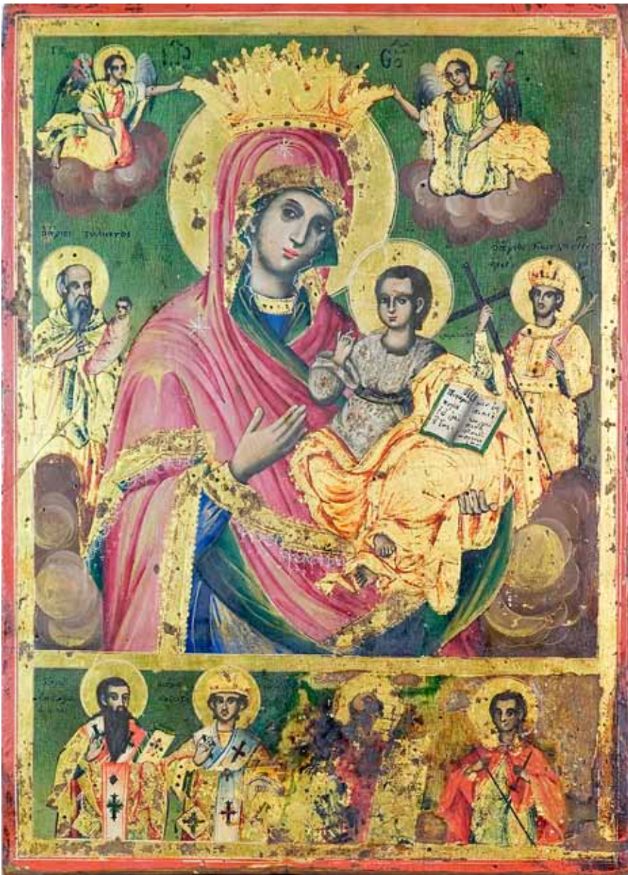
сл. 11. икона, Богородица царица со Христос, Св. Константина, Св. Стилијан, тројцата Јерарси, Св. Димитриј, црква Св. Никола Геракомија 1864

на од арханџелот Михаил, св. Александра Солунска и св. Атанасиј Персиски, во долната зона средишното место го имаат Константин и Елена со Чесниот крст помеѓу себе. Нив ги придружуваат, зад Константин св. Никола и св. Стилијан, а зад Елена св. Харалампије и св. Стефан архиѓакон. (сл.10) Вака конципирани икони кој покрај средишниот мотив на Богородица со Христос содржат и претстави на повеќе светци ќе биде особено популарна и прифатена во уметноста на доцниот среден век.