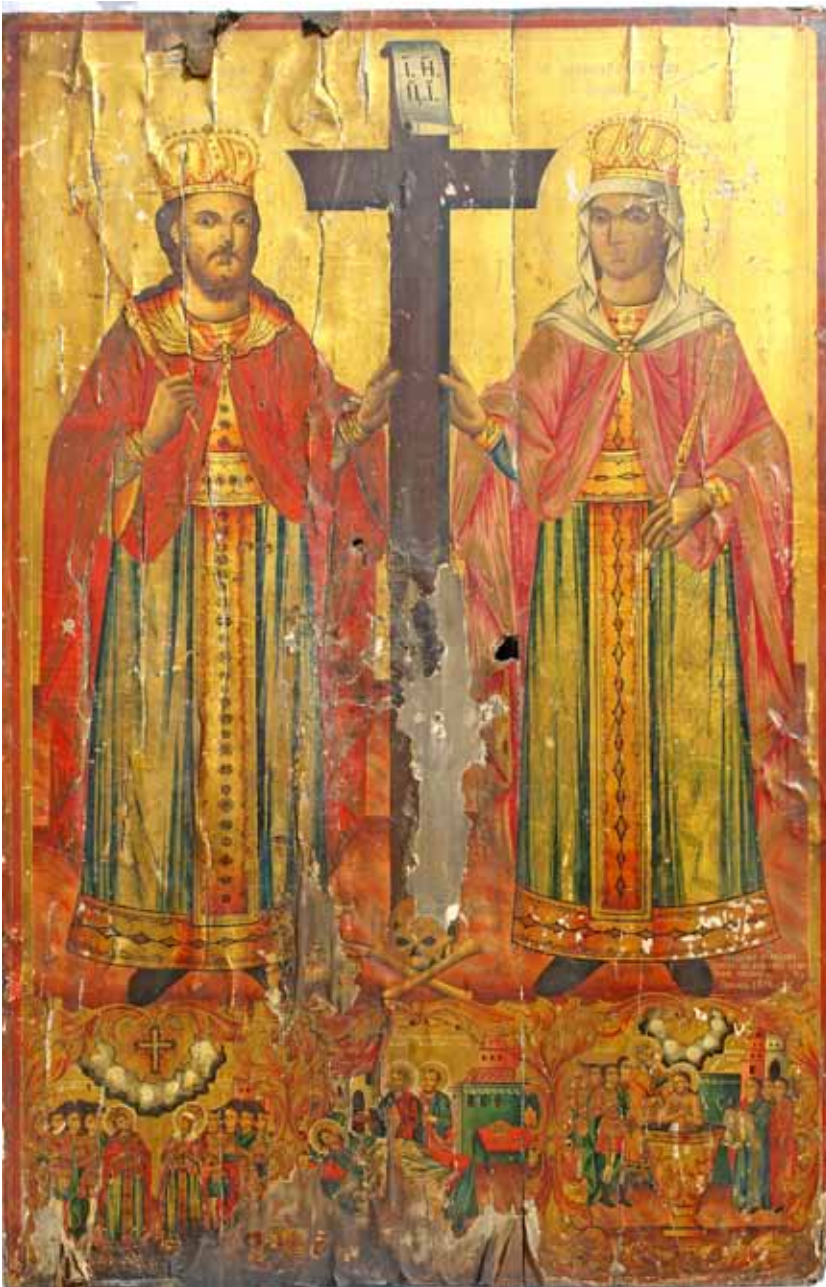
сл. 1. икона, Св. Константин и Елена, црква Св. Богородица, Битола 1878