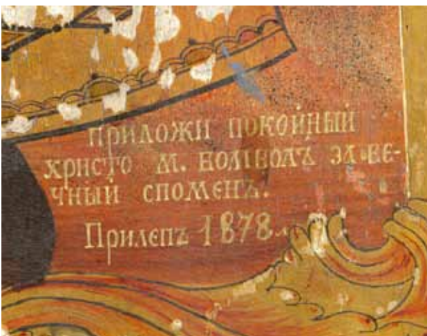
сл. 2. икона, Св. Константин и Елена, црква Св. Богородица, Битола - детаљ ктиторски натпис

Св. Константин во село Свеќани, 4 и црквата Св. Константин и Елена во Скопје позната од житието на кралот Милуин. 5 Во XIV век големиот духовник на Охрид, Партениј ја подига црквата посветена на Константин и Елена, каде што е насликан и најстариот циклус на Vita Constantini во византиското сликарство. 6 Истовремено заедничките претстави на Константин и Елена сликани меѓу Чесниот Крст влегуваат во самото јадро на иконографската програма на малите цркви и параклиси во Охрид 7 а тоа го бележиме и во живописот на Костур како протортон на архиепископијата. 8 Ова традиција продолжува и во уметноста на Охридската архиепископија од времето на Османлиската власт се до времето на доцниот среден век. 9