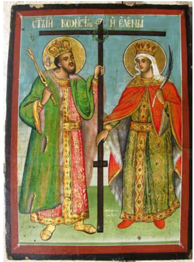
сл. 8. икона, Св. Константин и Елена, црква Св. Георги Лазарополе 1843, автор Дичо Зограф

кани во рамките на илустрираните циклуси иако произлегуваат од текстот на Vita Constantini . 12 Посебно е интересна сцената на Јавувањето на апостолите Петар и Павле во сон на царот Константин настан од животот на Константин која предходи на Крштевањето а во некои редакции на Житијата на царот Константин не е содржана. 13 Всушност оваа сцена е една од најретко сликани-те и ние како единствена аналогија засега ја наведуваме композицијата од припратата на црквата Св. Никола Дабарски кај Бања Прибојска. 14 Во житието е запишано, откако царот Константан се разболел од проказа-лепра и неможел да најде лек и покрај сите усилија на неговите доктори и пагански свештеници, во сон му се јавуваат двајцата апостоли Петар и Павле величајќи го неговото милосрдие кон малите дечиња кои тој не ги погубил, иако бил сосветуван дека ќе се излечи ако се измие со нивната крв. 15 Апостолите му говорат на царот да се сретне со епископот на црквата кој ќе