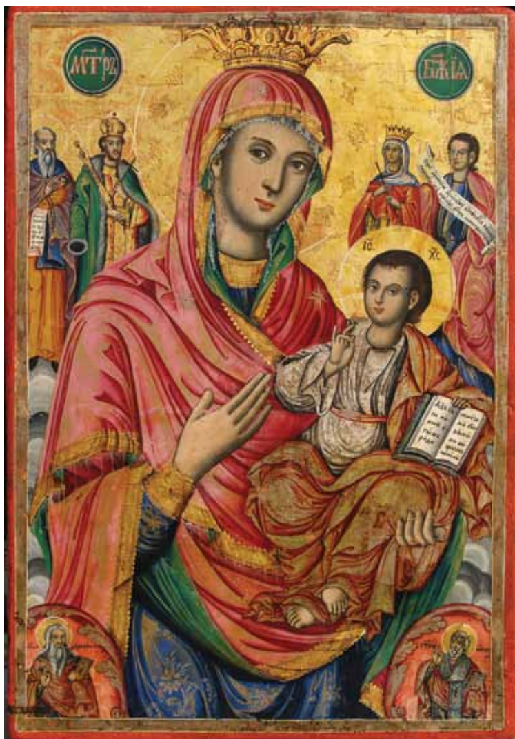
сл. 15. икона, Богородица со Христос, Св. Константин и Елена, Св. Стилијан, Св. пророк Данил, Св. Никола и Св. Харалаампиј, црква Св. Константин и Елена Скопје, 1860 Музеј на град Скопје